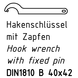
Hakenschlüssel mit Zapfen Hook wrench with fixed pin DIN1810 B 40x42

Copyright EWS Tool Technologies Weitergabe und Vervielfaeltigung dieser Unterlage, Verwertung und Mitteilung ihres Inhalts nicht gestattet, soweit nicht ausdrecklich zugestanden. Zuwiderhandlungen verpflichten zu Schadenersatz.