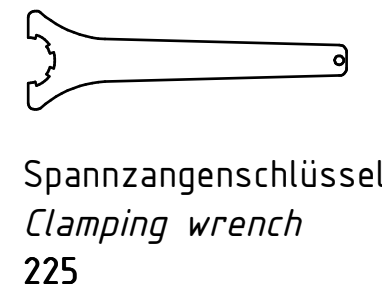
Spannzangenschlüssel Clamping wrench 225