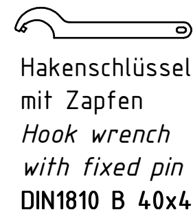
Hakenschlüssel mit Zapfen Hook wrench with fixed pin DIN1810 B 40x42